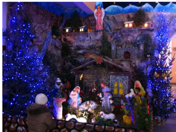
шопка в Золочеві

автор: отець Косма з братами та молодь парафії Також отець Косма завершив будівництво першого рівня храму в Ужгороді.