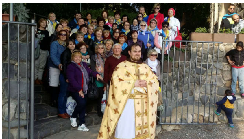
Різдво Христове у наших монастирях

В дні різдвяних святкувань своїми талантами славили Бога при нашій шопці семінаристи тернопільської семінарії та учні музичної школи міста Тернополя.