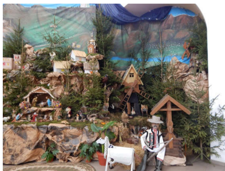
шопка в Гаях Шевченківських