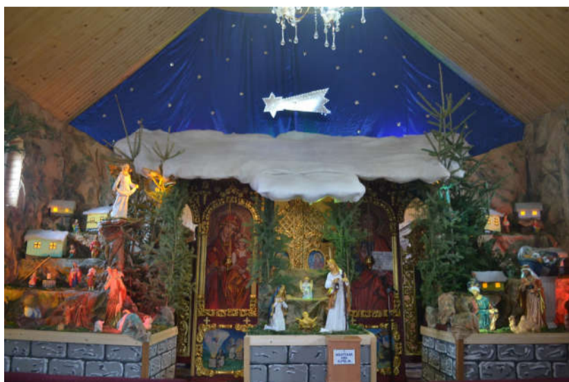
шопка в Хусті

автор: брат Еміліан з братами спільноти За неповний рік від моменту заснування парафії у Золочеві, завдяки активній праці наших братів сформувалася повноцінна громада. Були udzielені таїнства Хрещення та Подружжя. При парафії створені різні спільноти.