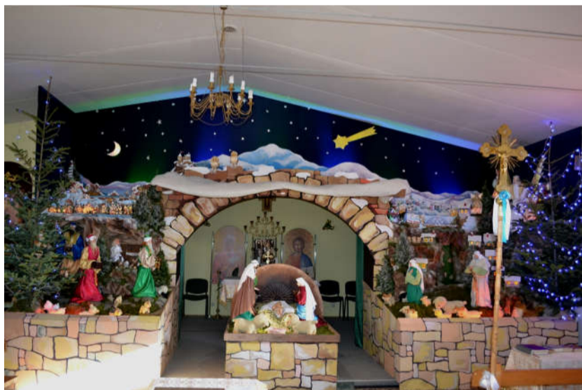
шопка в Ужгороді